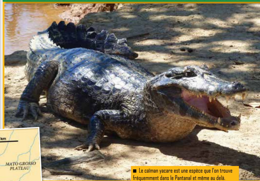
■ Le caïman yacare est une espèce que l'on trouve fréquemment dans le Pantanal et même au delà.