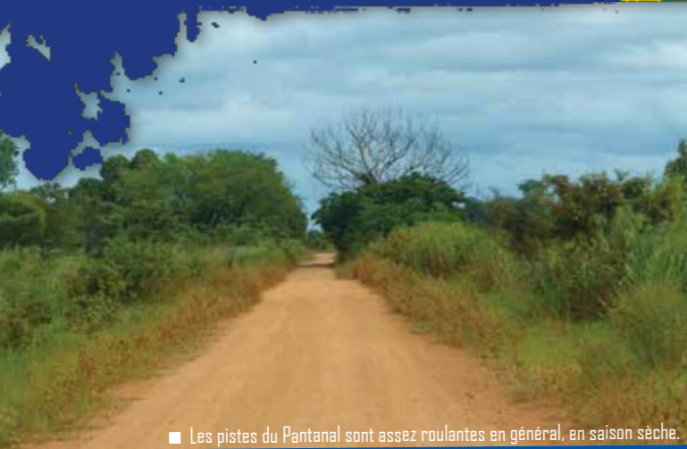
■ Les pistes du Pantanal sont assez roulantes en général, en saison sèche.