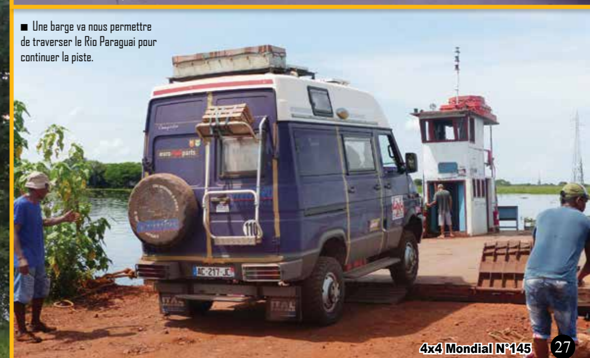
Une barge va nous permettre de traverser le Rio Paraguai pour continuer la piste.