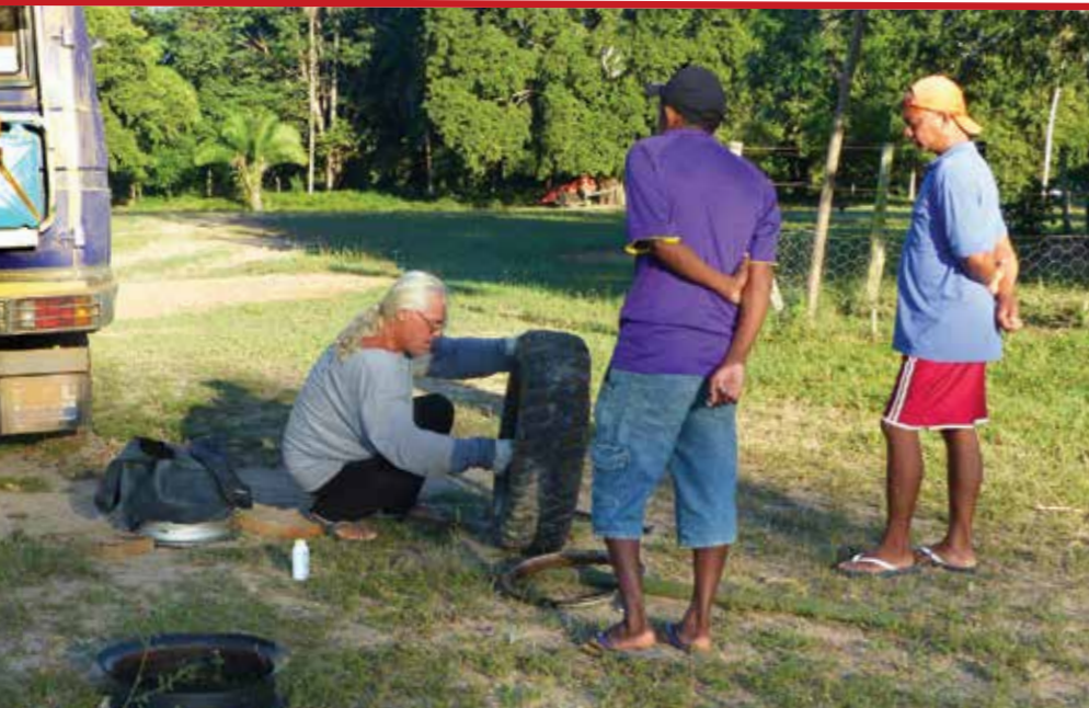
■ Heureusement que nous avons des jantes cerclées, nous avons pu réparer sans problème en changeant notre chambre à air percée...