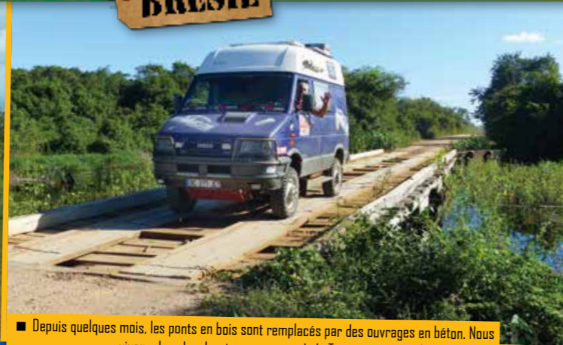
■ Depuis quelques mois, les ponts en bois sont remplacés par des ouvrages en béton. Nous vivons donc les derniers moments de la Transpantaneira des années 70.