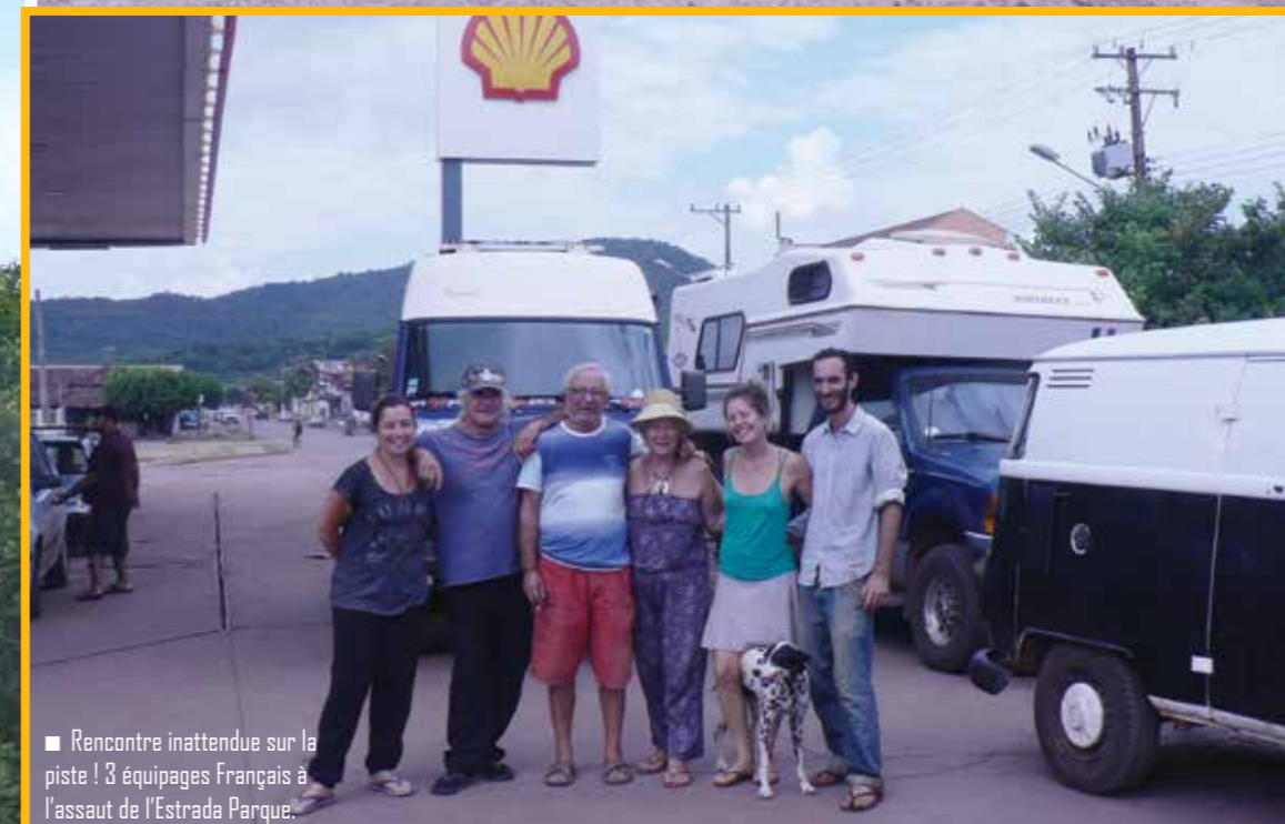
Rencontre inattendue sur la piste ! 3 équipages Français à l'assaut de l'Estrada Parque.