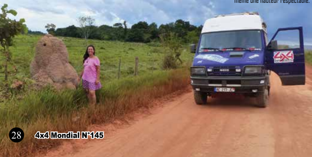
■ Pas aussi grandes que celles d'Afrique, cette termitière a quand même une hauteur respectable.