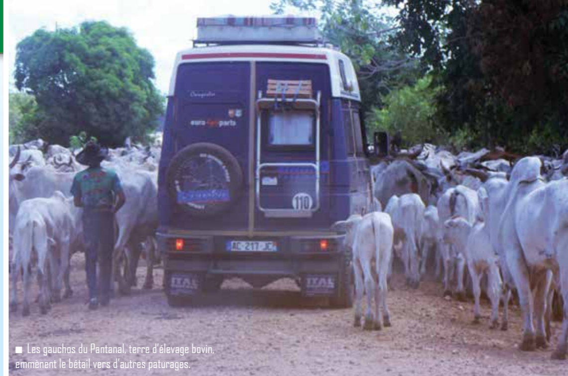
Les gauchos du Pantanal, terre d'élevage bovin, emmènent le bétail vers d'autres pâturages.

Nous choisirons le mois de mai, le début de la saison touristique. Il fait très chaud. Nous buvons quotidiennement jusqu'à 3 litres d'eau chacun. On aborde le Pantanal via l'Estrada Parque situé au sud. 120 km d'une belle piste de terre rouge, parsemée de solides ponts de bois traversant de nombreux marais. Les caïmans, les oiseaux de marais, les capybaras sont nos premières rencontres. Au milieu de la piste, on prend un petit traversier à plusieurs équipages et fait incroyable,