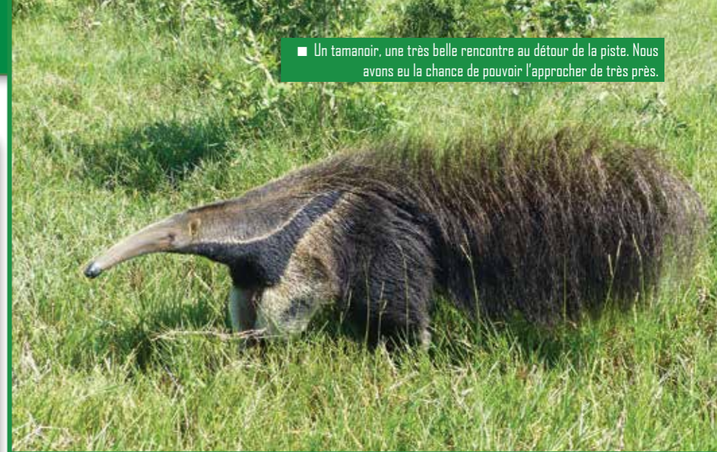
■ Un tamanoir, une très belle rencontre au détour de la piste. Nous avons eu la chance de pouvoir l'approcher de très près.

Précautions : Prévoir suffisamment de vivres, de carburant, d'eau potable et des répulsifs anti-moustiques. Il fait très chaud, l'air est parfois inexistant. C'est donc un environnement hostile.